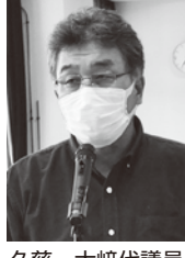
久慈・大崎代議員