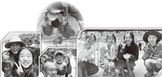
▲県庁支部いちご狩り交流会のようす

5月9日に宮城自治労会館で「臨時・非常勤等職員全国協議会東北地連交流学習会」が開催され、岩手県職労から3名が参加した。本部提起やグループワー