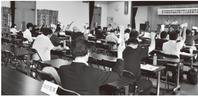
▲2026年度の運動方針を賛成多数で決定

6月13日、県職連合・県職労は定期大会を開催し、組織強化、賃金改善、権利向上、制度・政策要求等の運動方針について、代議員からの補強発言を受けて確立した。人事院及び県人事委員会闘争、人員確保要求書の提出等に向けた当面の闘争方針も決定した。結びに、大会宣言を満場一致で採択し、スローガン「結集と連帯」を確認のうえ、小田嶋委員長長の回結ガンパローで意思統一した。今回の大会も冒頭で自治労組合歌「限りなき躍進」の斉唱を行った。