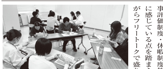
▲盛岡支部での若年層向け賃金学習会のようす

後半部分では、各テーパー単位で日頃から疑問（人事評価制度・休暇制度等）に感じている点を踏まえながらフリートークで盛り上