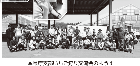
▲東北地連交流学習会のようす

声をおげることの大切さを知る 東北地連交流学習会 クを通して、会計年度任用職員制度や組合活動の進め方などについて、学習した。参加者からは、「職場によって処遇格差が様々あることを知り、みんなの意見を