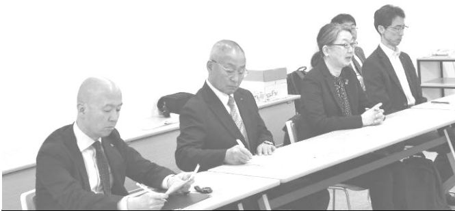
要請書の趣旨を説明し、改善を求める地公共闘

【地公共闘】佐藤議長から「月例給・一時金とも4年連続引上げとなったが、物価高騰に追いついていない。2026春闘では、大企業は5%のベアを勝ち取ったものの厳しい情勢が続いている。人員不足により4月1日時点での定数配置が出来ておらず、状況を打破するため今回要請書を提出したものの。人員確保のためにも、人事委員会としてしっかりと力を