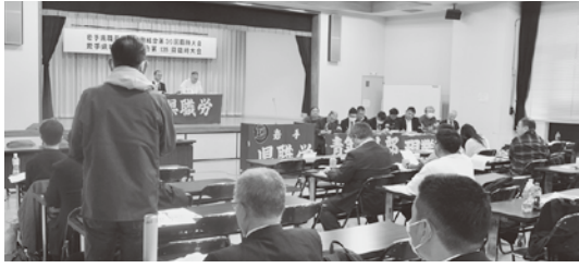
▲代議員からは様々な意見が出された