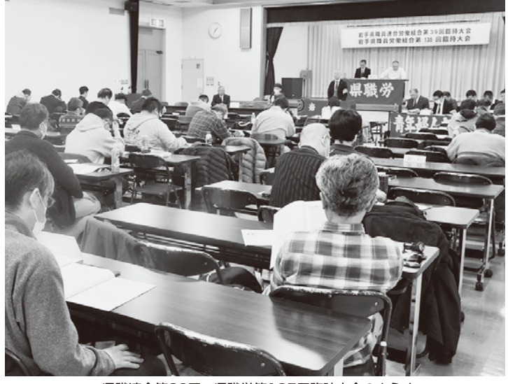
▲県職連合第39回・県職労第135回臨時大会の様子

県職労は、2月28日に県職連合第39回・県職労第135回臨時大会を開催し、代議員の発言により方針を補強のうえ、人員確保・賃金改善・長時間労働解消・危機事案対応改善等を柱とする2026春闘方針を確立し、3月9日に人事課総括課長交渉を行うこととした。また、春闘、人事院勧告・県人事委員会勧告、確定闘争に向けて重点的に取り組む活動のため、昨年10月18日の第124回中央委員会において職場討議に付していた2026年度特別闘争資金の徴収についても議論したうえで、承認された。