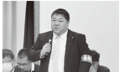
▲答弁する藤村書記長