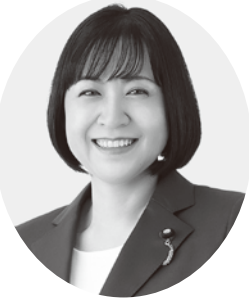
参議院議員 岸 まきこ 自治労組織内(立憲民主党)

今年の通常国会は、高市政権と対峙し、地域住民の暮らしを守る事が課題となつてきます。ネット上のもう一つのリアルな世界を含め政治の難しさを感じますが、組合員・家族の暮らし、地方を守るため、「鬼木まこと」とともに今年も現場主義で頑張ります。