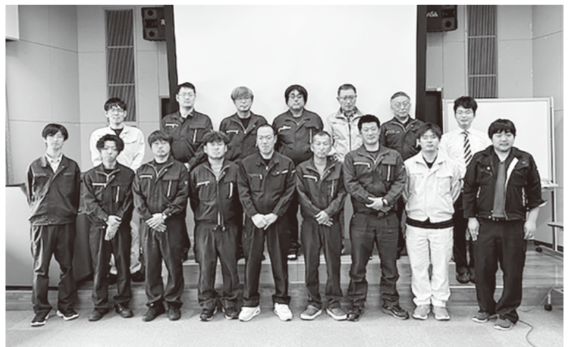
▲岩手県水産技術センター分会のみなさん

幡平市・岩手町・葛巻町の1市2町で香川県より少し小さな面積です。住民一人ひとりが快適に暮らせる地域の実現と、地元産業の経済活動を支えられるよう、道路や河川の整備と適正な維持・管理、土砂災害や岩手山の噴火に対する防災・減災対策などの業務に全員が力を合わせ取り組んでいます。管内には十和田八幡平国立公園、温泉、スキー場などがあり、多くの観光客が訪れます。とくに「雪の回廊」として全国的に有名な八幡平アスピーテラインの春先除雪も当センターが担当しています。