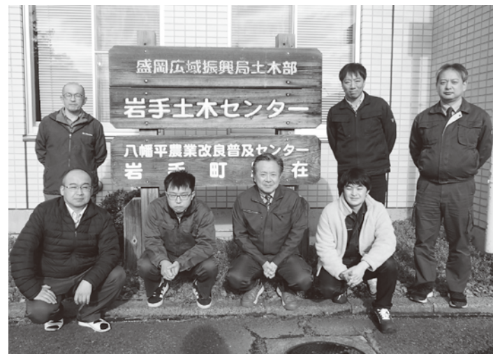
▲岩手土木センター分会のみなさん