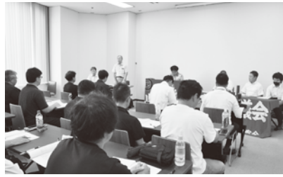
▲現業評議会定期総会のようす

8月23日、現業評議会は2025年度闘争及び現業統一闘争を全力で取り組み、組合員の生活と権利を守るための前進に向けた運動方針を確立すべく、全県から計23人の出席により定期総会を盛岡市で開催した。冒頭の菅原議長挨拶では「要求実現のためには現場の声を上げていくのが大事。今年は早い段階から新執行部の体制を整え、意見集約と併せて殆どの職場でオルグを実施し、各職場の