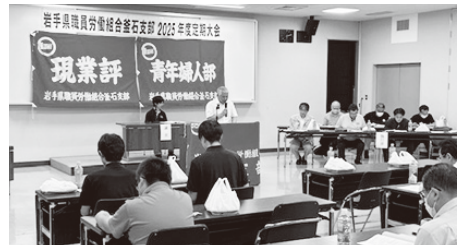
▲釜石支部定期大会のようす

場・生活実態から積上げた要求を組合員全体での共有化に努め、賃金労働条件の改善、業務量に見合った人員の確保をめざし、組織強化を基軸に、本部各支部と連携し、課題の解決に向けて運動の前進を図ることを柱として、組織強化のための組合活動の推進及び教育活動の推進、支部独自課題の解決に向けた支部独自要求の取組みなどの方針が提起され、賛成多数で運動方針が採択されました。最後は支部長の団結ガソリン