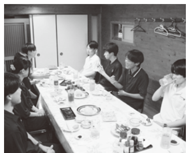
▲学習会後に懇親を深める

参加者からは、「組織を回す上で、また適正予算確保のためにも不払い残業はあつてはならないと思った」「予算もだが、個人の事務分担当の調整も必要。言い出しやすい職場環境も大事」といった声