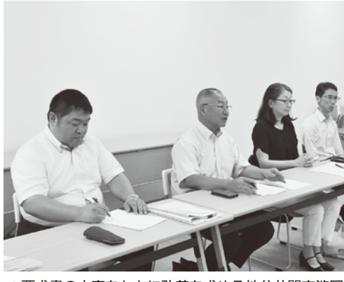
▲要求書の内容をもとに改善を求める地公共闘交渉団

実態調査のデータ整理を進めている」「人事委員会の使命は、日々職務に精励している職員の給与等の勤務条件について、社会情勢に適応した適正な水準を確保すること」「県民の理解の視点も大変重要」「中立・公正な第三者機関として適切に対応していきたい」などと述べた。