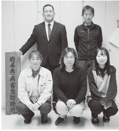
▲岩手県病害虫防除所のみなさん