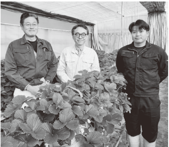
▲南部園芸研究室分会のみなさん