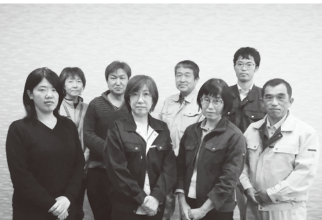
▲八幡平農業改良普及センター分会のみなさん

比べて水稲や果樹など農作物の生育が進み、病害虫の発生も早まり、南方から飛来する害虫が多くなる傾向が見られます。そのように変化する中でも、適切な病害虫対策ができるよう日々業務に邁進していきます。