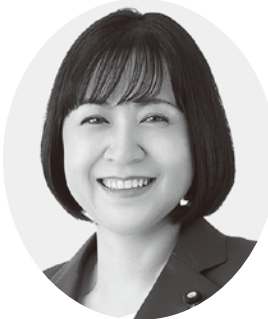
参議院議員 岸 まきこ 自治労組織内(立憲民主党)

明けましておめでとうございませう。 2024年は6月に改正地方自治法の成立を許してしまいました。私は昨年の改正は地方自治にとって非常に問題をばらばらであり、それを補う次期改正につながるため、法案審査等の場で繰り返し問題提起を続け、議事録に大臣や政府答弁を残すことに苦心惨憺しました。私の一丁目一番地であり、地方自治こそが住民を守る最後の砦だと思っております。 そして2025年、今夏は参議院議員選挙が行われます。政権交代のための第一歩として、立憲民主党の議席拡大、私「岸まきこ」 の2期目の議席獲得、「逆転の夏を再び!」のため全力を尽くします。そのためにも私自身、議員としての日々の活動の一つひとつに気合を入れて取り組む決意です。 また、発災から1年が経過してもなお復旧復興がままならない能登半島地震、全国で頻発する様々な自然災害の被災地のみならず、一日でも早い安寧した生活を取り戻していただくため、被災地や応援派遣で支援されている多くの自治労の仲間のみならずの声をしっかりと国政に届けてまいります。 声を力に、一歩前へ。ともにがんばりましょう。