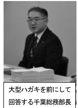
大型ハガキを前にして 回答する千葉総務部長

55歳昇給停止等、勤務意欲を損なう既存制度撤廃もぜひ検討を(総務部長) 国や他県との均衡を勘案しながら研究。職員全体の給与水準が民間や国・他県と均衡している中、昇給制度のみで対応を図ることは難しい。各任命権者と課題意識を共有しつつ、個々の職員の状況を勘案しながら、それぞれの職制や職種に応じた取組を進め、高齢層職員の勤務意欲の維持・向上に配慮していく。