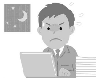
実績記録はしっかりと

併せて、 現場からも改善の声をあげていくことが重要である。超勤予算不足による不払いが生じないように、交渉の場と現場サイド双方から必要な超勤予算確保と適正な配分を強く求めていく。