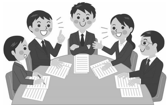
分会単位で職場意見交換を行おう

組合員が集まり、それぞれの働き方、執務環境の状況など今の職場状況を確認することが、職場の改善に向けて一人ひとりが意識できるきっかけとなり、具体的に必要な改善につながっていく。根拠ある「人員要求」とするためにも『分会基礎調査』をしっかりと取り組もう。