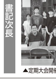
▲定期大会開催後、参加者で記念撮影をおこなった