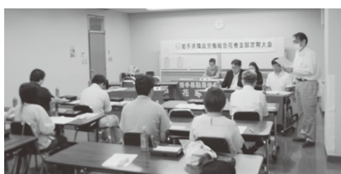
▲花巻支部定期大会のようす

花巻支部定期大会が9月3日、花巻地区合同庁舎会議室において開催された。大会冒頭、朴田支部長が「県職労本部拡大闘争委員会で、先月8日の人事院勧告について説明を受けた。月例給で1級11・1%、2級7・6%、3級3・1%、4級1・3%、5〜7級1・2%の給与引き上げ率であり、通勤手当が引き上げられ、一方、扶養手当は改悪