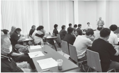
▲現業評議会定期総会のようす

み、組合員の生活と権利を守るたたかへの前進に向けた運動方針を確立すべく、全県から計29人の出席により定期総会を盛岡市で開催した。