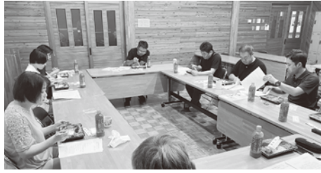
▲林業技術センター(盛岡支部)での意見交換会のようす

により会計年度任用職員を 通年で雇えない。 ○業務量は確実に増えているのに人が減らされている状態であり、1人当たりの業務量が確実に増えている。