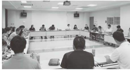
▲農業研究センター(北上支部)での意見交換会のようす

○専門職種の欠員が生じているため早期に解消してほしい。 ○研究員が3人で予算都合