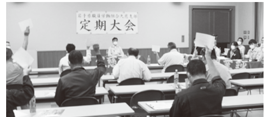
▲欠員解消、加入促進などについて確認した久慈支部定期大会

久慈支部は10月6日、定期大会を開催した。大会では、定期人事異動後の異動等による欠員の早期解消、加入促進への取り組み、職場に応じた会計年度任用職員を配置させるための取り組みなどを確認した。また、組合員の声を局長や経営企画部長に直接届けることができる支部独自交渉では、二戸支部と合同