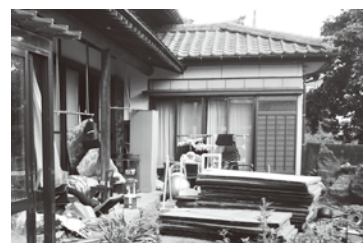
▲新潟県村上市の被害家屋での復旧作業の様子

お話を伺って来ました。その家は、床上50cmまで浸水し、1階の畳、布団、家具などが汚水に浸かりました。汚水に浸かった畳は、男性2人がかりで屋内に搬出しましたが、真夏の作業は、大変な重労働でした。家屋からの泥出しや一時に大量に出る廃棄物への対応など、多くの課題が浮き彫りとなりました。線状降水帯による被害は、今やどこでも起こります。先の9月議会では、災害ボランティアの確保や被災家屋の衛生対策などについて当局を質しました。今後も引き続き自治体の防災力強化について取り組んでまいります。