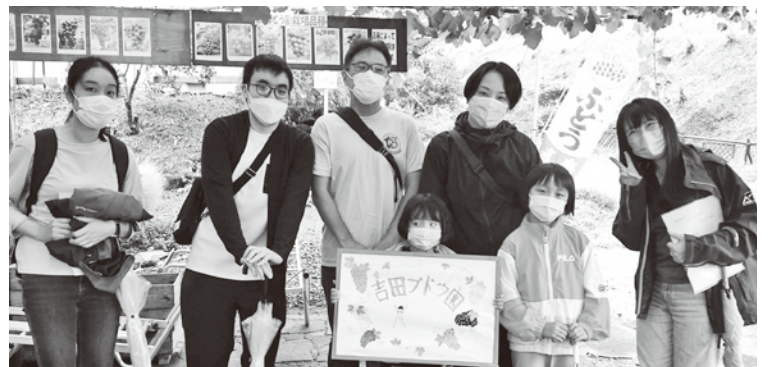
▲ぶどう狩りを楽しんだあと、参加者で記念撮影

交流会では、花巻支部の独自要求も共有し、公舎に冷房設置を求めていることを知った参加家族から「冷房がないなんて信じられない」と驚きの声が出された。