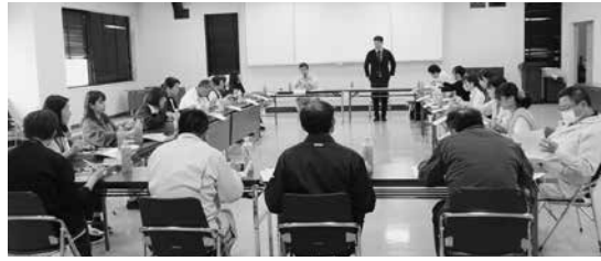
▲釜石支部での会計年度任用職員学習会のようす

広島平和公園にある平和の灯をトーチに掲げ、「核のない平和な社会の実現」「平和行政の推進」などを訴えながら、岩手県内を3日間かけてリレーでつなぎ、縦断する取り組みです。