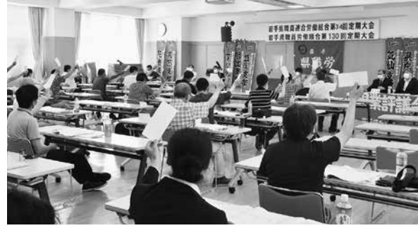
▲昨年度の定期大会の様子

県職労は6月1日、定期大会を開催し、2024年度運動方針を議論する。昨年度の運動の到達点を振り返るとともに、「みんなで討論、みんなで決定、みんなで行動」する運動の強化・拡大を図り、職場実態点検や組合員との討論を通じて職場課題を明らかにする中で「譲れない要求」を積み上げ、要求の実現に向けて一人一人が積極的に結集する組織づくりをめざす。そのための運動方針を提起し、代議員の討論による方針の補強をめざす。