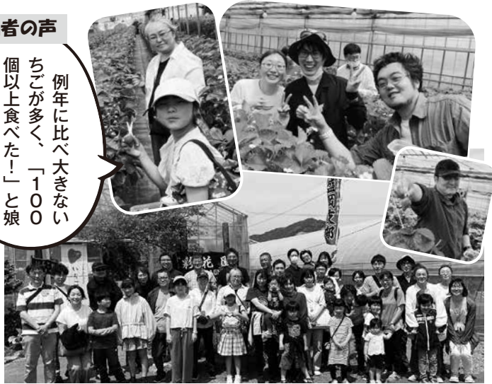
▲5.11に行われた盛岡支部での交流会のようす