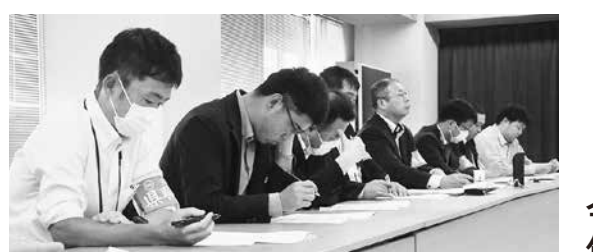
▲交渉に臨む県職労交渉団

《②賃金・労働条件改善・生活向上》 勤務意欲を維持できる賃金改善や、若年層の初任給改善（初任給格付改善を含む）、昇給・昇格運用の改善等の要求を掲げ、各闘争を取り組む。また、通勤手当、住居手当の改善を求めていく。