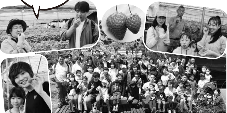
▲5.12に行われた県庁支部での交流会のようす

夏季休暇については、夏季が繁忙期にあたる職員等、7月～9月の夏季休暇取得可能期間中に十分に取得できない状況があり、県職労で取得可能期間の拡大を要求してきた。その結果、今年から取得可能期間が2か月間拡大し、6月～10月の期間で取得可能となった。 夏季休暇は、職員の権利です。計画的に取得しリフレッシュしましょう!