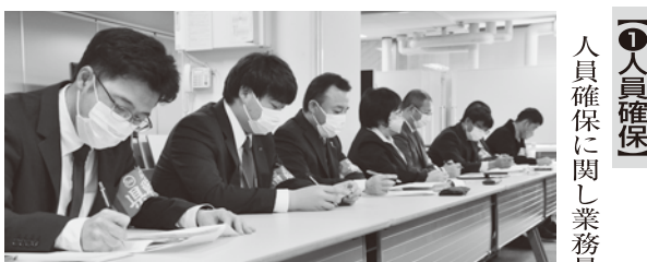
▲人員確保等について回答を求める県職労交渉団

適時適切に検討」との考えを示した。交渉団から、長時間労働の是正や多忙化の解消に向けて、しっかりと対応するよう求めた。