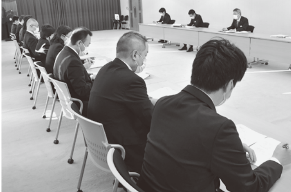
▲諸課題の前進回答を求め交渉に臨む地公共闘交渉団 (手前)

適時適切に検討」との考えを示した。交渉団から、長時間労働の是正や多忙化の解消に向けて、しっかりと対応するよう求めた。