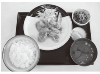
▲日替わり定食550円(この日はからあげです)