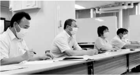
▲分会基礎調査の結果を踏まえ人員不足を訴える交渉団

7月13日、県職労は知事あて人員確保要求書を内城人事課総括課長に提出し、業務実態に見合う人員確保に向けた基本姿勢を質すため交渉を行った。要求書には分会基礎調査(中間集計)の結果を踏まえた人員不足の実態を伝え改善を求めた。併せて、任期付職員の任期の定めのない選考採用枠拡大と勤務実績を考慮した採用を求める要請書を提出し、貴重な即戦力の確保と適切な対応を求めた。