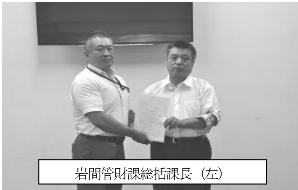
岩間管財課総括課長（左）

管財課運転技士の 17 人体制の維持は必要と考えている。公用車の更新についても、公務災害となれば、運転手だけでなく乗車している人にも影響があることから問題意識を持っており、まずは今年度 2 台の予算要求を実施。今後についても、必要な車種については適切に予算要求を進める。