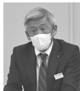
内城人事課総括課長

（人事課長）仮に「勤続加算枠」を措置する場合は、基本的に昇給しない57歳以上を対象とすることが考えられるが、その場合、対象者の人数が少ない部局では、結果として配分数が少なくなるなど現業職員特有の課題も考えられる。皆さんの意見を踏まえながら、勤続加算枠の取扱いについては研究していきたい。（裏面に続く）。