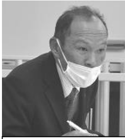
小野（一関）運転技士

(現業評) 振興局土木部運転技士の補充の在り方、配置の方向性について検討状況は。 (人事課長) 所管区域の事業規模や、特殊車両の管理方法など、振興局ごとに大きく事情が異なることから、全県で画一的な配置ではなく、個別具体的にその都度検討し決定していく必要があると認識。現場の業務状況を把握しながら適正な配置に向けて調整していく。 (現業評) 再任用のみ配置のところもある。大型特殊機械の管理、災害対応は新規補充してもすぐ対応できない。新規採用と併せ1～2年技術伝承できる体制も考慮すべき。