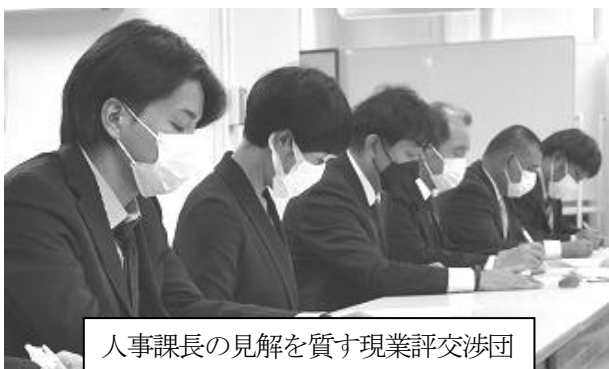
人事課長の見解を質す現業評交渉団