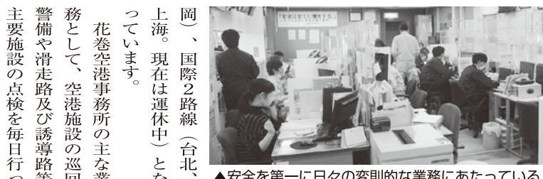
▲安全を第一に日々の変動的な業務にあたっている

コロナ禍のなか利用者数は伸び悩んでいますが、令和元年度までは年間約40万人の利用者数となっていました。現在、就航路線は国内5路線（札幌、名古屋、神戸、福岡）と、国際2路線（台北、上海）に拡大しています。