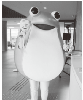
▲PRキャラクターの「ケロ平」

岩手県立平泉世界遺産ガイダンスセンターは世界遺産「平泉」の価値を広く伝え、後世へ継承するための拠点施設として令和3年11月20日に平泉町の柳の御所遺跡史跡公園隣接地にオープンしました。世界遺産及び関連する遺跡への周遊の出発点として、その価値や特徴を分かり易く伝えるとともに、柳の御所遺跡から出土した資料の展示・収蔵、平泉文化に関する調査研究を行っています。