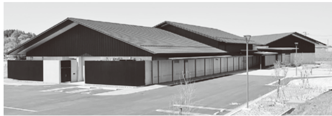
▲平泉世界遺産ガイダンスセンターの外観