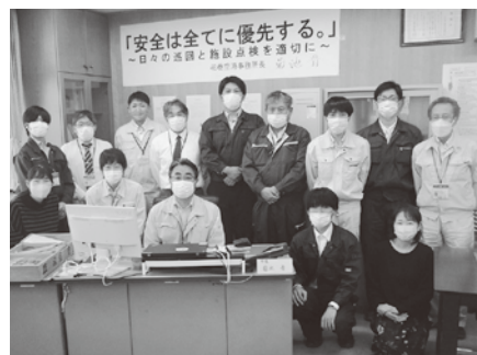
▲花巻空港事務所分会の皆さん

岩手県立平泉世界遺産ガイダンスセンターは世界遺産「平泉」の価値を広く伝え、後世へ継承するための拠点施設として令和3年11月20日に平泉町の柳の御所遺跡史跡公園隣接地にオープンしました。世界遺産及び関連する遺跡への周遊の出発点として、その価値や特徴を分かり易く伝えるとともに、柳の御所遺跡から出土した資料の展示・収蔵、平泉文化に関する調査研究を行っています。