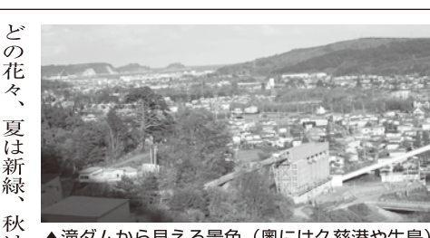
▲滝ダムから見える景色（奥には久慈港や牛島）

滝ダムは、久慈市中心市街地より南西方向に位置しています。ダムに隣接して管理事務所があり、職員4人十人計年度職員、当直員9人の計13人で業務を行っています。 滝ダムの目的（役割）は、①洪水調節、②河川環境の保全等、③発電の三つです。大雨時の洪水調節は緊張感が伴います。水力を利用して発生した電力は、「久慈エネルギー株式会社」を通して、県の久慈合庁やアンパホール（久慈市文化会館）等に配電されています。ダム湖周辺は、春は桜な