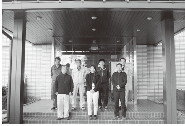
▲滝ダム管理事務所分会の皆さん