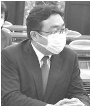
実態訴える・農研山口分会長