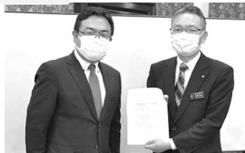
農業部門要請書を手交（農研・山口分会長）

大畑室長から「研究部門に必要な人員・予算の確保に向けて努める」姿勢を引き出すも、要求している研究部門の体制強化に向けた具体的な改善策は十分でなく、継続課題となった。引き続き、課題を集約し、改善を求めていく（主な交渉結果は裏面）。