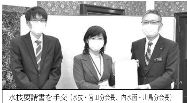
水技要請書を手交（水技・宮田分会長、内水面・川島分会長）