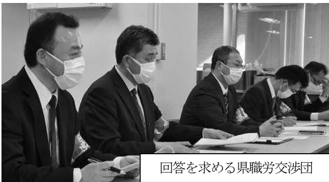
回答を求める県職労交渉団

【交渉結果】①来年度の人員配置は「新採用は150人規模。再任用職員は原則希望者全員を再任用とし、新規40人、更新98人、計138人。欠員は本年度並(15人程度)」が示されたが、欠員解消はもとより非常災害時への対応を踏まえれば、職場に必要な人員配置には程遠い。さらに、「会計年度任用職員は知事部局1,806人(▲129人)と震災分の公共事業費減に伴う任用数減」を示した。県職労交渉団から、 今もなお各職場では人が足りない実態を強く訴え、職場で必要となる会計年度任用職員の配置を求めた。