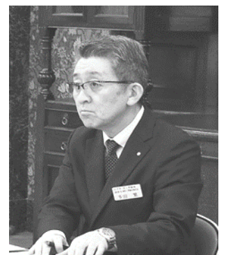
回答する多田県整室長

交渉では総論的に長期的視点での人員確保の姿勢を確認するも、具体的な改善方策まで示されず、多くが継続課題となった。交渉団から、現場実態を踏まえた技術職員の処遇改善を含めた一層の対策を求めた(主な交渉結果は裏面)。