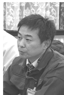
業務の平準化策を求める盛岡土木金今さん