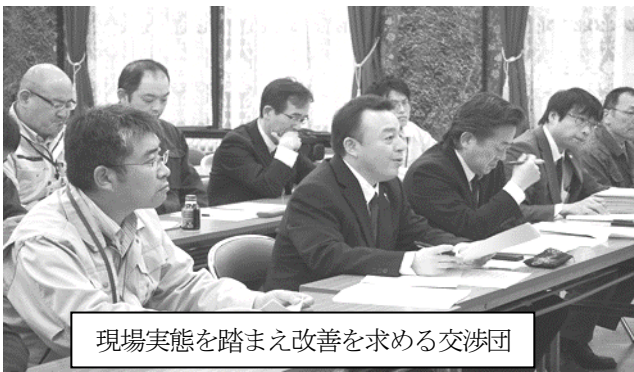
現場実態を踏まえ改善を求める交渉団

【交渉結果】 人員確保 に関し、「大災害に対応した長期的な人員確保は大切。部全体の課題として認識。総合土木は確保が困難な状況だが、 人員確保はあらゆる手法で確保に努める 」との姿勢を引き出した。一方、 専門職種の代替確保 (育休・病休等)は「 年度途中の代替職員は臨時職員の配置が精いっぱい 」と困難な姿勢を示したことから、 交渉団から業務執行