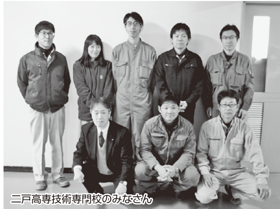
二戸高等技術専門校のみなさん

県職労には数多くの分会があり、その規模も職種も様々です。組合員の皆さんは、第一線で日々仕事をしながら、職場環境の改善を求めて頑張っています。今年度は、盛岡支部の「岩手県立消防学校分会」と二戸支部の「二戸高等技術専門校分会」を紹介いたします。