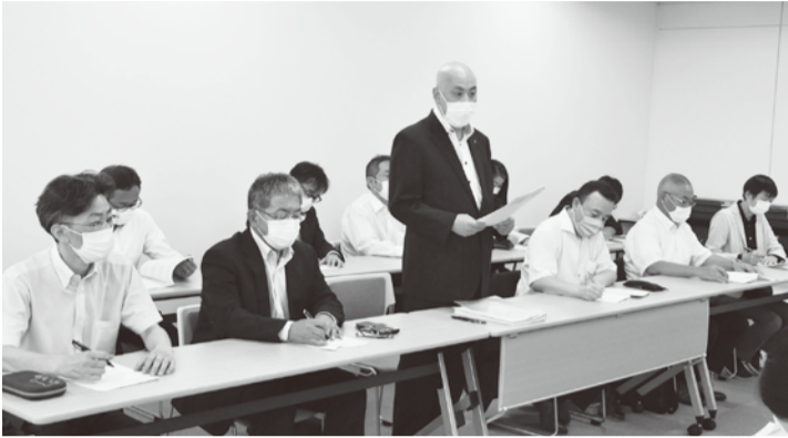
▲21県人勸に向け前進回答を求める地公共交渉団

月2回刊=1588号 2021年9月30日 発行 発行日 毎月15日30日 発行所 盛岡市内丸10番1号 岩手県庁内 岩手県職員労働組合 印刷所 盛岡市上田二丁目17-4 有限会社 ジョー印刷企画 一部 40円 組合員購読料は組合費に含む