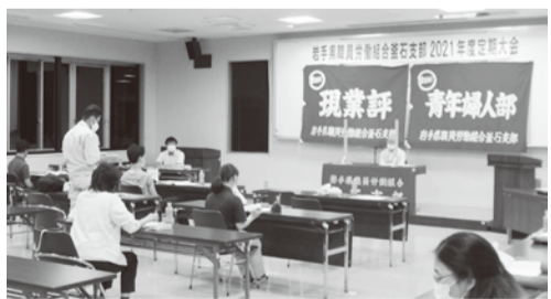
▲運動方針について確立した釜石支部定期大会