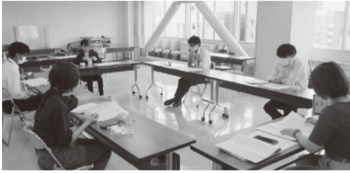
▲盛岡支部での学習会のようす