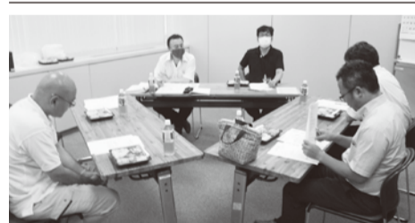
▲二戸土木センター分会の意見交換

【参加者の声】臨時職員(事務補助)が、会計年度任用職員の切り替わりに半分の4人へと減らされた。用地・建築・管理で2人、土木技術企画・道路環境・道路整備・河川砂防チームで2人の短時間勤務に。その結果として、事務補助の一部が正規職員の業務に加算され、かつ席も遠く頼みづらいなど、業務に影響も。運転技士に関しては、時間外勤務となっても手当が支給できない弊害もある。最も著しいのが県民サービスの低下である。そもそも少ない正規職員で、現場業務も多い中、電話や来客