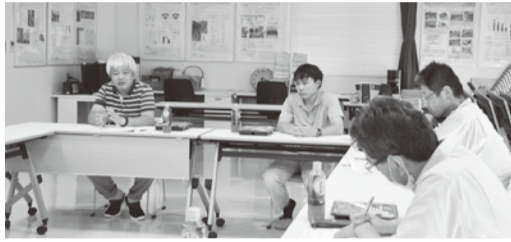
▲南部園芸研究室分会の意見交換

南部園芸研究室分会の意見交換では、「予算措置が外部研究資金がメインとなっており、県単研究費は減額となっている。各農業改良普及センターや各地域から必要とされる研究テーマが十分行いきれない状況」、「外部研究資金の研究はテーマが制約されており、現場の実情と合わない場合が多い」、「県単の施設修繕の経費が措置されず運営が厳しくなっている」とし、予算措置の在り方の改善を訴える声が上がった。さらに、「会計年度任用職員の勤務時間が削減され、必要時に作業を依頼できず、職員自らハウス等の管理や修繕を担っている。職員負担も大きい」とし、会計年度任用職員の勤務時間の改善を強く求める意見が挙げられた。