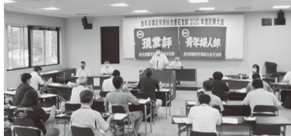
▲釜石支部・定期大会の様子

の応援なくして感染対策も成り立たっていないのが実情である。このことを私たちが受け止め、人員・労働条件改善を求めていくことが重要」とあいさつ。その後、今年度の新採用職員全員加入まであと一人までできていること、会計年度任用職員の新加入も報告し、引き続き過年度採用者の組織拡大の取り