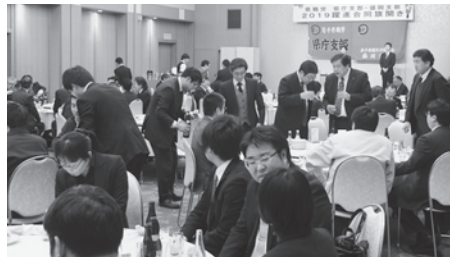
▲和やかな雰囲気の中、盛岡支部合同旗開き