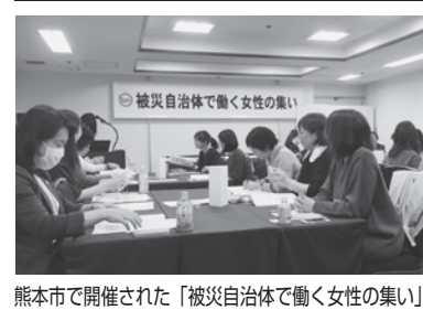
熊本市で開催された「被災自治体で働く女性の集い」

「精神疾患」若年層・本庁などを増加傾向 部局ごとの「高ストレス者対策」も求める 12月26日(水)、議会棟第2会議室を会場に、第2回職員安全衛生管理委員会が開催された。 委員会では、本年度の健康管理の取組みの中間報告と各支部の職員衛生委員会 2,517人(前年2,444人・63人増)との報告があった。 精神疾患による療養状況は、2018年11月末現在で療養総人員55人(前年42人・13人増)、療養総日数5,537日(前年4,188日・1,349日増)であった。 県職労から、精神疾患が増加傾向にあり、特に若年層・女性・本庁地区が増加となっており、職場復帰の具体的な取組み等求めた。ストレスチェックでは、高ストレス者286人(前年292人・6人減)と前年度とほぼ横ばい、地区別では釜石・県央・本庁地区の順で高いと報告。依然として高ストレス対策は必要であり、県職労は、部局毎でも高ストレスの割合に偏りがあることから、それぞれの課題を検証し対策を行うよう求めた。 施設の無料開放で利用者は11月末現在で延べ438人(アスレチックルーム177人、トレーニングルーム261人)であり、体を動かすリフレッシュに加え、利用者同士のコミュニケーションもはかれるといった二次的効果も報告された。 安全点検実施状況が示され(表中)、県職労として対策の予算化を求めた。また、職場の適正な湿度管理対策に加湿器の設置検討の状況を質したところ、検討状況が示されなかったことから、冬季での健康管理の観点から早期の検討を求めた。 保健福祉部健康国保課から、2020年4月の受動喫煙防止法全面施行の対応について説明があり、県職労から喫煙する職員の配慮が不十分となる懸念があると発言し、喫煙者に配慮した検討を求めた。