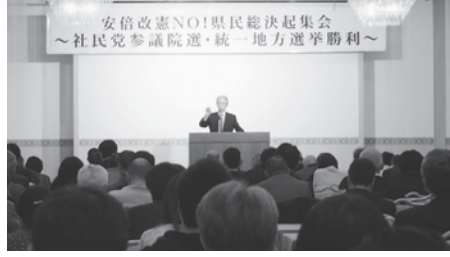
▲安倍改憲NO!県民総決起集会

1月5日、社民党県連合と平和環境県センターは、「安倍改憲NO!県民総決起集会」を盛岡市で開催。各労組等から400人が結集した(うち県職労15人)。