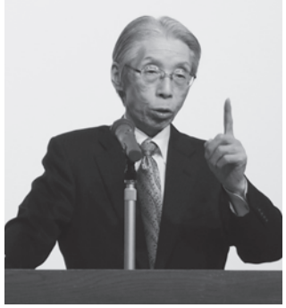
▲講演する又市征治党首

過労死・過重労働も後を絶たない。GDPの6割を占める個人消費の増のためには大幅賃上げ・最低賃金引上げ・社会保障制度の充実こそが不可欠だ。まさに安倍政権の経済政策は失敗であり、実質可処分所得の増大による生活改善の政策に転換すべ