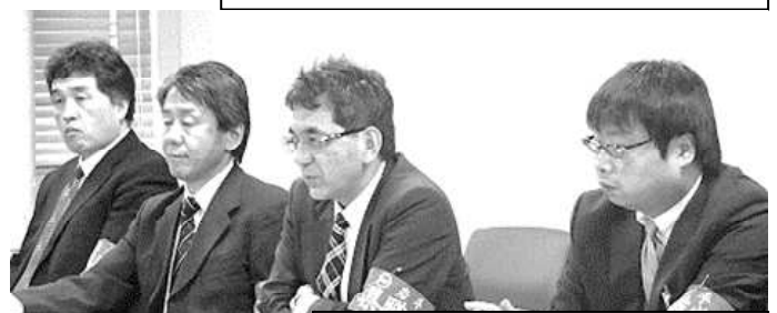
改善回答を求める県職労交渉団

給与改定・退職手当 に関し、10月23日地公共闘交渉と同様に国の改定の動向が明らかでないことを理由に 具体的な方向を示さなかった 。 諸手当改善 も現状認識にとどまり、遠距離通勤や主に沿岸部の家賃高騰で自己負担を強いられる実態への 改善策が全く示されなかった 。 獣医師等の専門職種の処遇改善 も、従来の対策に触れるにとどまり、 消極姿勢のままであった 。