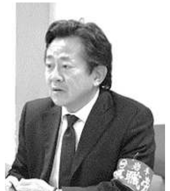
岩泉土木災害復旧への人員配置を訴える口岩中執

(県 職 労) 欠員解消の現状と解消に向けた具体的な見通しは 。 (人事課長) 8月1日時点は欠員102人。行政職65人、総合土木26人など(4月1日時点)。特別募集で32人採用し、一定数の欠員は解消してきた。見通しだが、震災復興に加え、 政策課題の対応など新たな人員配置に対応する必要があるため、現時点で具体的な見通しを明確にすることは困難 。人員確保の取り組み継続と事業の効率化、重点化に配慮し欠員解消に努める。 (県 職 労) 来年度に向けて少しでも欠員解消に向けた具体内容を示すべき。 任期付職員の任期の定めのない職員の選考採用拡大を要望している 。見解は。 (人事課長) 採用枠は 退職者数や他の採用試験の採用予定数を総合的に勘案し、決定 。即戦力となる人材の確保を目的としており、その趣旨も踏まえて判断していく。 (県 職 労) 消極姿勢だ。 欠員解消と働く意欲のある職員の確保のため、採用枠の拡大を要望する 。