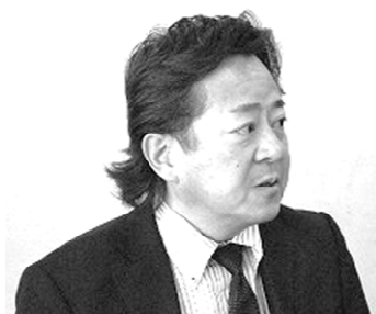
運転技士課題を追及・口岩中執

(県 職 労) 運転技士は災害応急対策も従事し、現場では不可欠な存在。新採用の増もあり、運転業務の支援も必要との意見も。直営堅持を強く求める。