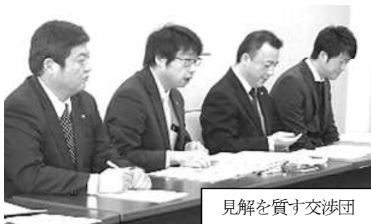
見解を質す交渉団

【交渉結果】人員確保・年齢バランスに応じた人員配置に関し、「あらゆる手段で確保に努める。特に電気職は優先的に確保」、「年齢バランスは課題を認識。社会人採用も進めており、中長期的視点も持ちながら解消に努める」、「沿岸部の総括主査は難しい管理業務をせざるを得ないのは認識。各公所の状況を確認し、人員配置に努める」とした。交渉団から、岩泉土木や内陸部各公所の人員課題を訴え改善を求めた。人