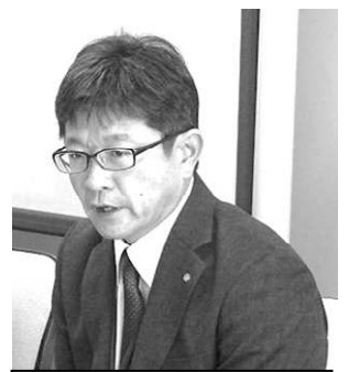
回答する小原県整室長

人員確保では基本姿勢を引き出すも、具体的な改善策の提示に至らなかったことから、現場実態を踏まえた人員増を強く求めたところ、室長も必要な改善に努めるとした（主な交渉結果は裏面）。