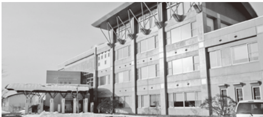
▲東北農業研究センター・この一室を借りて業務にあたっています

試験研究機関や関係機関・団体との連携を図りながら、県内各地域の普及センターを支援しています。 畜産チームは、久慈・二戸地域の大家畜経営安定のため、生産者を巡回し、新技術の導入等を直接指導しています。 私たちは、公用車で移動する機会が多く、また、畑の脇道や山の中を移動して農作物の調査等を行うので、安全と負担軽減のため、公用車の4WD、オートマ車への更新を要望していただきます。