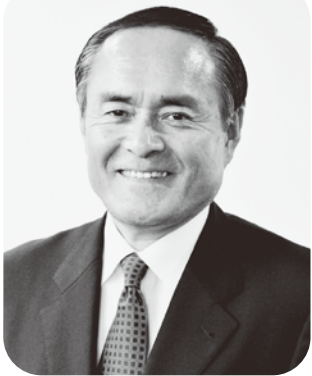
前参議院議員 (社会民主党)

体選挙と参議院選挙が行われます。今後行われる自治体選挙において、自治労組織内・推薦候補を擁立し、数を増やしていくことが必要です。また、参議院選挙では、私自身、社民党・比例代表予定候補者として議