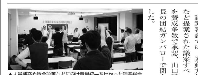
▲人員補充や賃金改善などに向け意思統一をはかった現業総会

「組合は強い組織だと思」という言葉を聞いた。参加者の一人が話した言葉が忘れられない。「組合は強い組織だと思」という言葉を聞いた。参加者の一人が話した言葉が忘れられない。