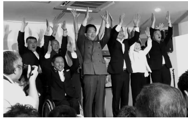
▲早々と当選が決まり喜びの万歳三唱をする達増拓也氏(右から4人目)