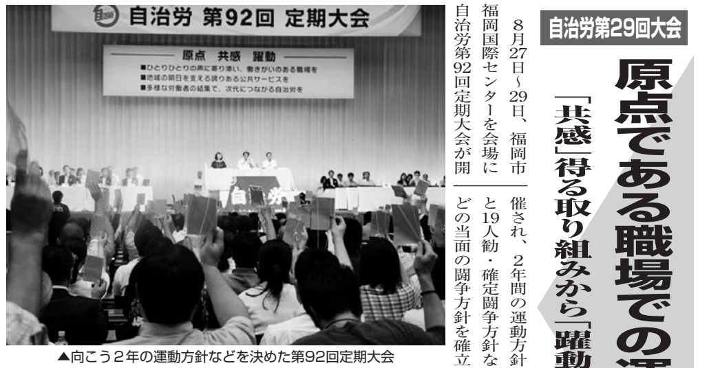
▲向こう2年の運動方針などを決めた第92回定期大会

また、10月には県人事委員会勧告が出される予定であり、県職員の人権を守る立場で、月例給・一時金の全世代の引き上げと諸手当の改善など、県職労の皆様とともに全力で取り組んでまいります。これまでのご支援に心から感謝し、今後ともご指導をよろしくお願いたします。