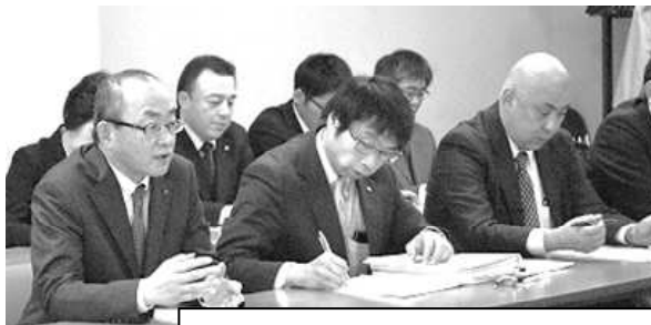
前進回答を求める地公共闘交渉団

現給保障対策は「高齢層職員の皆さんに対し、このような対応となったことは心苦しいところ。大変大きな課題であり、 現給保障対象者の状況も1つの視点として勤務意欲確保に向け取り組みを進めるよう、私から重ねてお願いする 」と回答したことから、来年4月を見据え一層の対応を強く要請した。