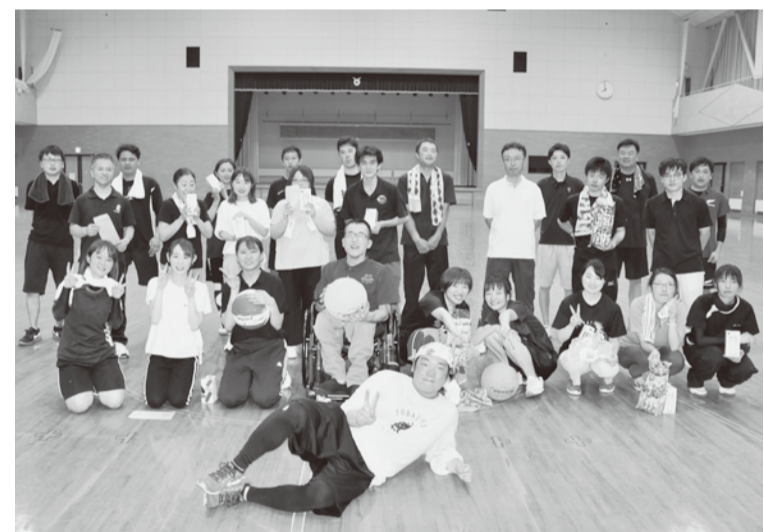
▲歓迎交流会の後に集合写真に納まる参加者の皆さん

胆江支部青年婦人部は、8月28日(金)「新採用歓迎スポーツ交流会」を開催した。新採用5名、会計年度4名を含む26名が参加し、体育館で熱戦を繰り広げ、部局を超えた交流を図った。