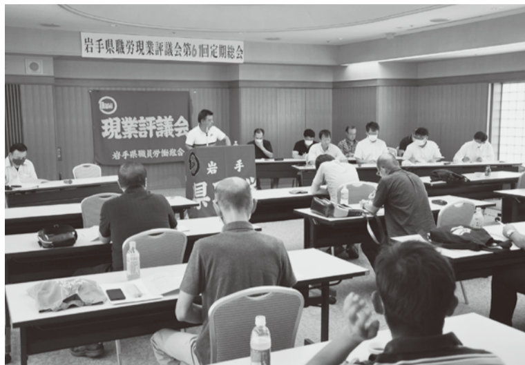
▲秋のたたかひに向けて意志統一をはかった現業評議会

9月5日、現業評議会は2020年確定闘争及び現業統一闘争を全力で取り組み、組合員の生活と権利を守るたまたかへの前進に向