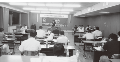
▲活動方針などを確認した気仙支部定期大会

順次進めていると聞く。気仙支部でも居住環境の確保に関する独自要求に取り組みたい。是非とも皆さんのご協力を」と挨拶。