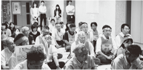
▲交渉団を支援する緊急の座り込み（県庁11階フロア）