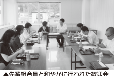
▲先輩組合員と和やかに行われた歓迎会