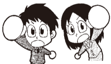
岩手県地方公務員共闘会議

政府は人事院見解に基づき退職手当を78万1千円引き下げる国家公務員退職手当法の改正を予定している。しかし5年前に退職手当は約400万円削減され、さらに、給与制度の総合的見直しをはじめとした度重なる賃金削減を受けている。これ以上の退職手当の削減は職員の勤務意欲の失墜はもとより、地方での人材確保が一層困難となります。知事はこれ以上の賃金削減ではなく、生活の活力と勤務意欲が確保できる賃金改善こそ行うべきです。退職手当引下げに断固反対します。