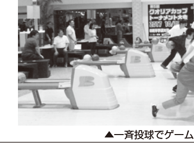
▲一斉投球でゲームを開始