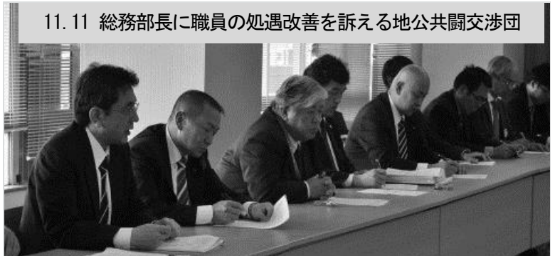
11.11 総務部長に職員の処遇改善を訴える地公共闘交渉団

【越年となった経過】 昨年10月19日の県人勸を受け、10～11月の間、12月議会での給与改定に向け交渉を行っていたが、当局は国家公務員の給与改定が決定していないことを理由に、12月議会での改定を見送るとの 前例のない判断 を行った。このことから、 月例給・一時金の改定及び給与制度の総合的見直しなど、賃金確定の交渉を越年することとなった。