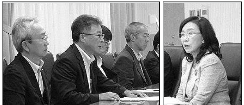
基本姿勢を質す公務員連絡会交渉団（左）と見解を示す一宮総裁（右）