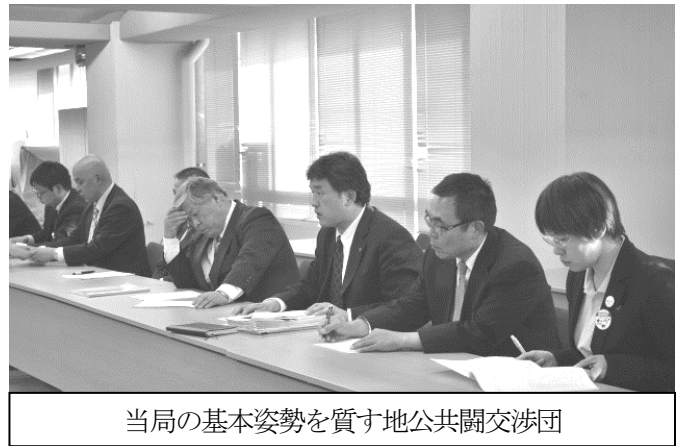
当局の基本姿勢を質す地公共闘交渉団