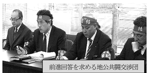
前進回答を求める地公共闘交渉団

通勤手当は、 交通用具利用 に関し、ガソリン価格の動向に触れ、 現行の手当水準の維持は困難 とし、 引下げを検討 とする一方、 交通機関利用は支給限度額が他県より