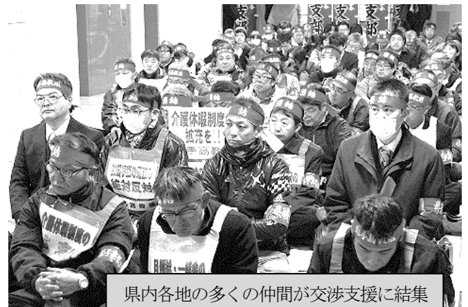
県内各地の多くの仲間が交渉支援に結集

(人事課長) 経過措置について、制度上の額と現給保障額との差額は平均で3,300円程度。今後の昇給等により相当程度解消されると見込むが、一部の高齢層職員は昇給の効果が限られ、解消に至らない場合もある。勤務意欲の取組みも制度の範囲内との制約があり、 各任命権者で職員個々の状況を勘案し、工夫できることがないか必要な取組みを検討していく。