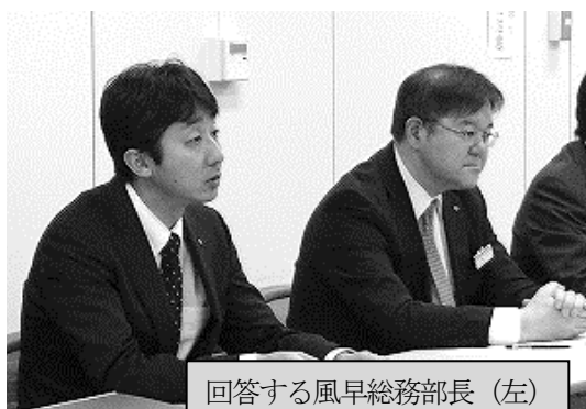
回答する風早総務部長 (左)

地公共闘は減額措置の受け入れは難しいと表明しつつ、総務部長から「一層の財政努力や職員の勤務意欲確保など継続課題をしっかりと取り組む」との決意を引き出したことから、減額措置の早期終了を要請し、提案は「やむを得ないものであり、受け止める」と表明、交渉を終了した。地公共闘では、2016確定闘争からの継続課題の具体的な改善に向け、引き続き取り組む。