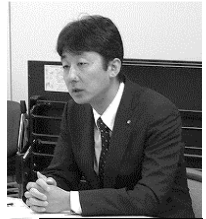
弁明する風早総務部長

(総務部長) 2016年度～2018年度までの中期財政見通しでは、公債費が低減する見込みであり、一定の成果が上がっているものの、社会保障関連費の自然増等により、今後の財政運営は依然厳しい状況である。今年度以降で、概ね150億～200億の収支ギャップが見込まれ、財源対策基金の取り崩しにより賄うとすると、2018年度末には基金残高が300億程度減少し、160億程度となる。よって、全体的な歳出削減努力を継続する必要がある、人件費も対象とするとの判断に至り、 やむなく給料の特別調整額について減額措置をお願いした。長期間にわたり減額をお願いすることになり、大変心苦しいが、県財政の状況を理解いただき、御協力願いたい。