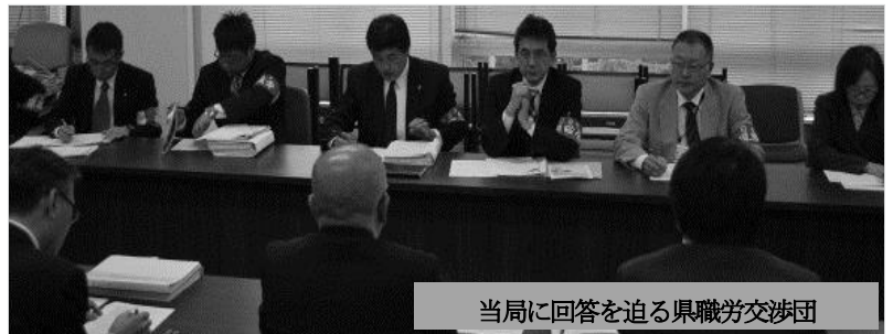
当局に回答を迫る県職労交渉団

《県 職 労》現給保障対象者のうち、半数が未だ対処されていない。引き続き対応していくことを要請するが、 制度として見える形での処遇改善を行うべき。