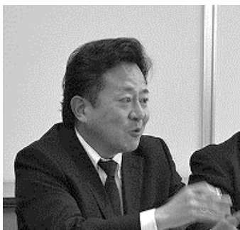
職場実態を訴える口岩中執