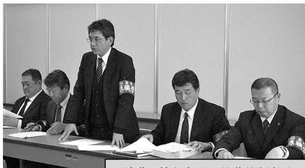
前進回答を求める県職労交渉団