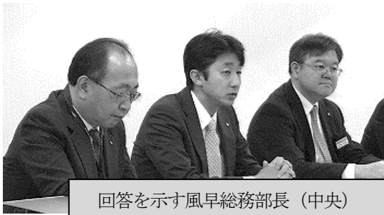
回答を示す風早総務部長（中央）

（地公共闘）県人勸の内容は配偶者の手当を大きく減額するため手当が必要な世帯への影響が大きく、子どもへの配分も十分とは言えず改悪となる要素が大きい。改めて 実施しないよう求める 。