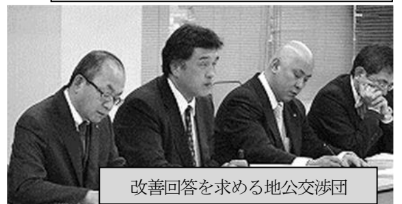
改善回答を求める地公交渉団

を35,000円(▲3,300円)に引き下げ調整 とのこと。 交通機関利用では、職員負担の実態を捉え全額支給限度額を1万円引上げ、55,000円とする とし、 いずれも来年1月から実施 、との回答を引出した。