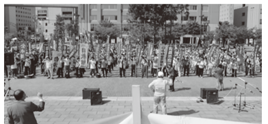
5月30日に開催された第30回反核燃の日全国集会

す。平和や戦争について色々と議論されていますが、「人の持つ様々な感情」を抜きに語ることはできないと思います。