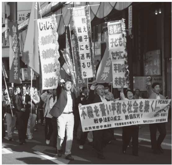
5.16「不戦を誓い平和な社会を築く県民集会」

「東アジアの諸外国の核兵器や弾道ミサイルなど大量破壊兵器の脅威があるから、日本も武力が必要」として、憲法9条を変えるべき