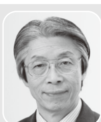
参議院議員 又市征治

労働者のみなさまに頼られ、国民の選択に値する社民党に脱皮するために、「対話続行・改革断行」をスローガンにして社民党改革を推し進める決意です。今後のご支援ご指導をお願いします。