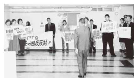
県人事委員会委員への要請行動

1980年代の自治労は、組織分裂を引き起こしていました。この年ようやく沈静化。岩手では3月に、自治労推進県本部と岩手県事務所が統一大会を開催し、新生「自治労岩手県本部」がスタートしました。 毎年恒例、秋の「県職労スポーツ祭典(通称・スポーツ祭)」が、15回目となるこの年から運動会形式で行われ、