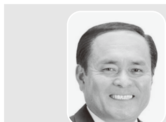
社会民主党党首 参議院議員 吉田忠智

主な出来事 4月 東京都豊島区に、アジアで一番高い60階建(地上239・7メートル)の超高層ビル「サンシャイン60」が開館 5月 新東京国際空港(現在の成田国際空港)が開港