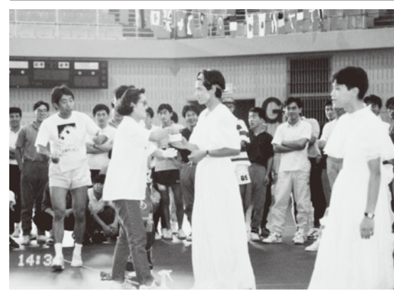
ミスターレディーコンテストのもよう