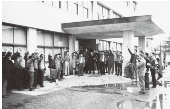
春闘での花巻支部集会のもよう

それぞれ味がある機関紙となっています。 賃金闘争は、春闘期での決着に向け、4月25日、2時間ストライキを全支部で実施しました。当時の人勧制度では、官民較差が5%以上ある場合にのみ勧告が義務づけられていました。 が、5%以下でも勧告を行うとの示唆を得るなど、2時間ストへの結果により大きな意義を持つ成果を得ることができました。 船舶関係では、9月、4