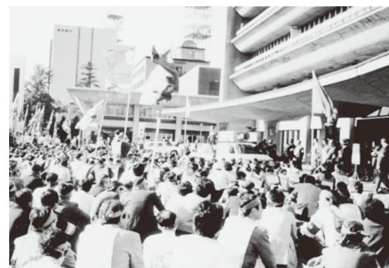
県庁前広場を埋め尽くした「一時金の傾斜配分導入」阻止集会