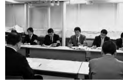
要求事項について説明し改善を求める交渉団

遇改善、欠員解消と業務実態に基づく人員確保、任期付職員の任期の定めのない職員への採用枠の拡大、超過勤務手当の完全支給と適正な勤務時間管理、休暇制度の拡充など121項目からなる春闘要求を含めた17春闘方針をはじめ、国の退職金見直しの動きへの対応