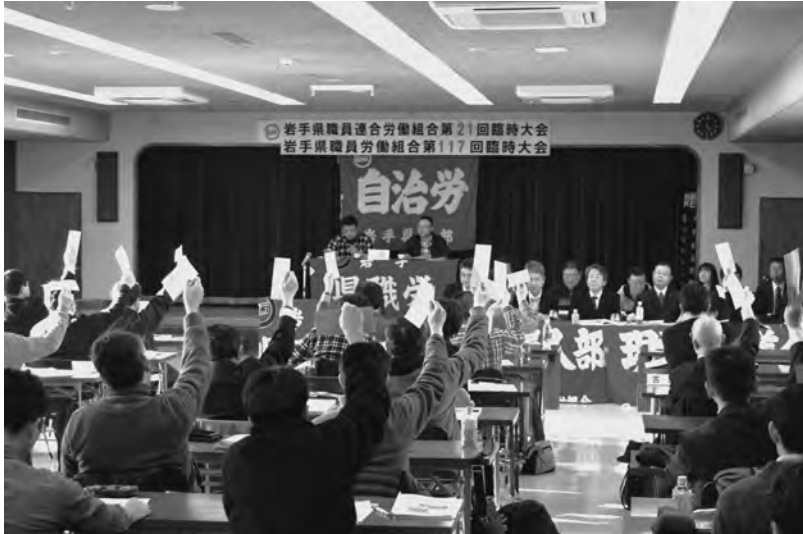
課題解決に向け、当面する春闘に全力で取り組むことを意思統一した臨時大会

開会に当たり、小野中央 きた発令日までの3週休日執行委員長から「人事異動の確保を反故にしたことは時期となるが、内示日に閣極めて問題だ。沿岸部を中心に住居確保が困難などの