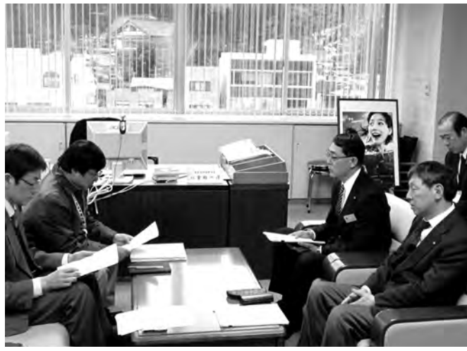
要求書に基づいて改善を求め交渉を行う執行部(左)