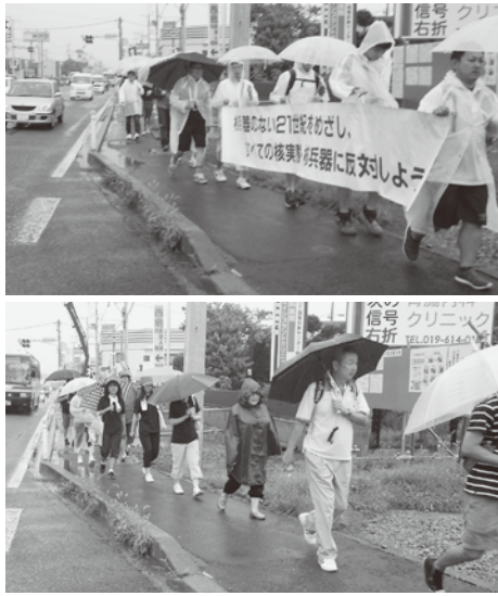
雨のなか、津志田の大国神社から教育会館めざしての平和行進