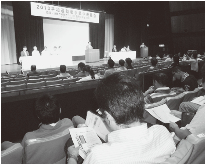
教育会館で行われた2013平和運動県中央集会