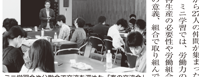
ミニ学習会や分散会で交流を深めた「春の交流会」

る実態が多く職場から上がっている。当局は予算確保していると言っているが、現場と乖離があることが明らかである。 このことから、人員確保を強く求めるとともに、超勤不払いの実態を摘発し、予算確保と実態に則した支給をさせるため取り組みを強化する。 職場からの要求を基に賃金労働条件の改善要求を基