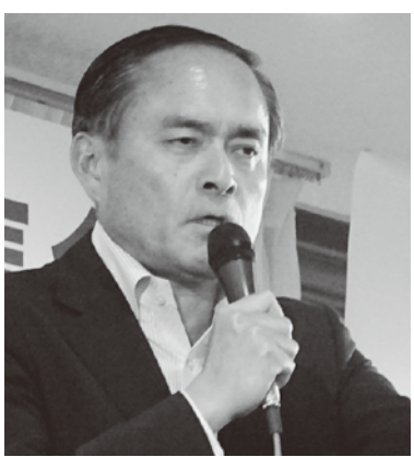
5.23総決起集会で決意を述べる吉田ただとも参議院選挙首 非正規雇

「安倍」暴走政治を止めよう 5・23「吉田ただとも」勝利総決起集会開催 5月23日、自治労本部構成単組を中心に7月の参院選での社民党党首「吉田ただとも」勝利に向け、総決起集会を開催。吉田党首から本選挙の争点と立候補に向けた熱い決意表明があり、勝利に向け意思統一した。 「吉田ただとも」さんは「3年半に及ぶ安倍政権に今回の参議院選挙の焦点を審判を下すこと」、「憲法改悪を許さない」の2点を掲げた。「アベノミクスの経済政策は格差拡大、不正規雇