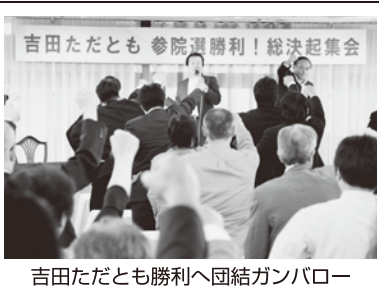
吉田ただとも勝利へ団結ガンパロー

「安倍」暴走政治を止めよう 5・23「吉田ただとも」勝利総決起集会開催 5月23日、自治労本部構成単組を中心に7月の参院選での社民党党首「吉田ただとも」勝利に向け、総決起集会を開催。吉田党首から本選挙の争点と立候補に向けた熱い決意表明があり、勝利に向け意思統一した。 「吉田ただとも」さんは「3年半に及ぶ安倍政権に今回の参議院選挙の焦点を審判を下すこと」、「憲法改悪を許さない」の2点を掲げた。「アベノミクスの経済政策は格差拡大、不正規雇