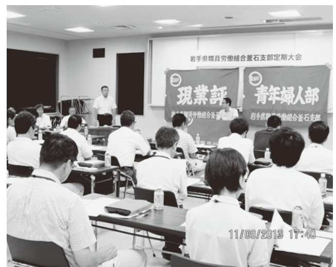
活発な発言が出された釜石支部定期大会

じちろう マイカー共済 カーライフを応援する、頼れる補償 車両損害補償の 『おすすめ安心タイプ』 は 一般補償 + 付随諸費用補償