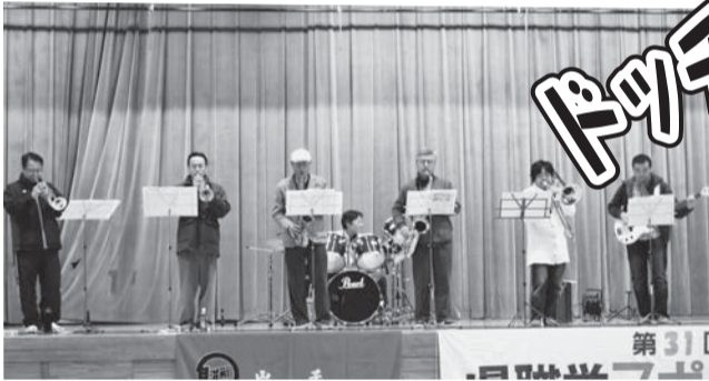
ココロの元気復活セミナー（Vol.2）県職労バンドによる演奏会フルメンバーとはならなかったが、見事な演奏にアンコールも