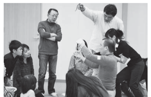
何センチか？ 少しでも長く…。（柿の皮むきリレー）