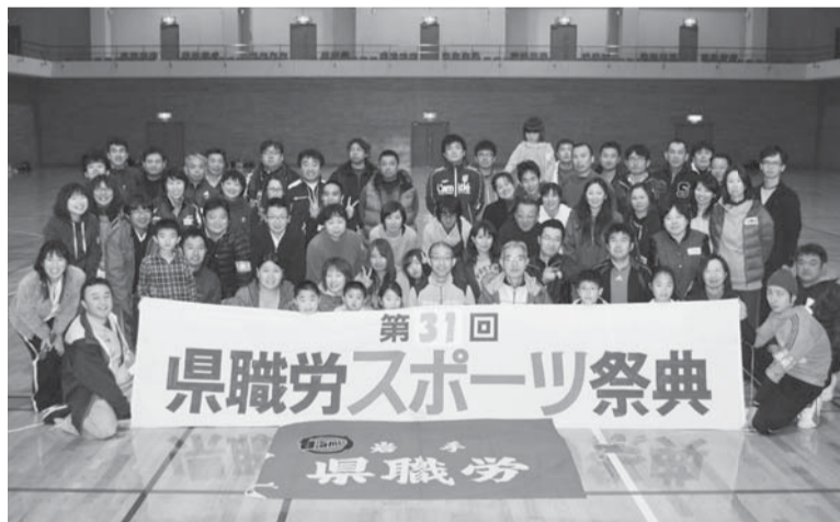
1日目の終わりにみんなで集合写真！