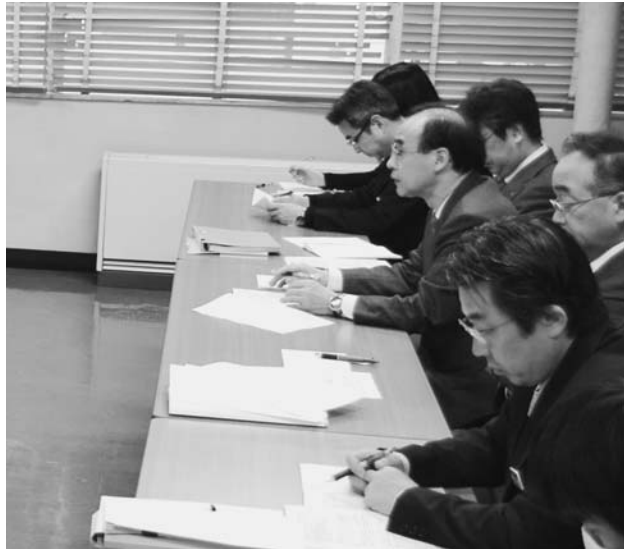
独自課題の前進に向けて総務部長交渉に臨む県職労(左)と県当局側(右)