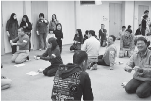
なかなかうまく伝わらな〜い。（ジェスチャー伝言ゲーム）