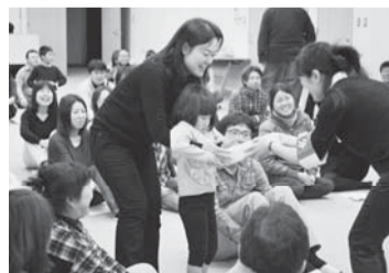
ちょっとはずかしいかな…。お母さんと一緒に〇×クイズで商品ゲット。