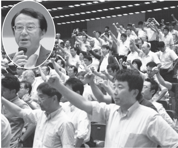
人事委員会勧告闘争・確定期闘争勝利に向け団結ガンパロー(円内は、決意を述べる福島自治労本部書記長)

自治労は確定期闘争に向けた闘争方針を協議すべく、9月7日、労働条件担当者会議を開催。会議では、本年の給与改定に関し、総務省が県人委會事務局及び県当局に留意事項を示したことに触れた。総務省が地方が国にない独自の給与調整や手当制度を設けている実