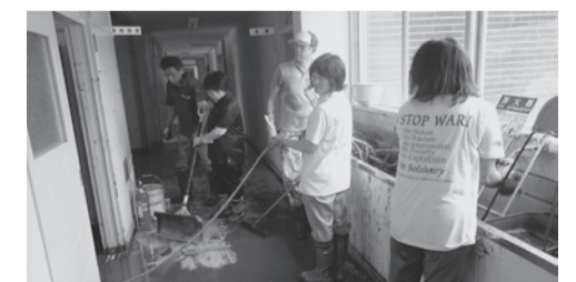
泥のかき出しなどに精を出す応援職員 (9/3)

金については、公民較差の全額解消と給料表では解消できない原資分の差額調整やその他手当への加算を求める、②扶養手当は当該自治体の労働者の支給実態を踏まえ、拙速な見直しを阻止することを柱とする確定期闘争方針を提起、各県本部からの補強発言を受け、方針が確立された。