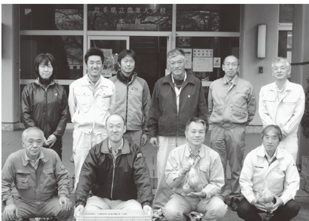
農大分会の皆さん