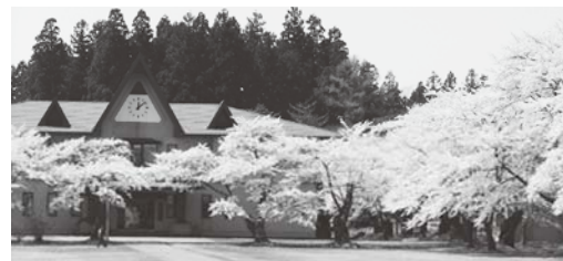
農大キャンパスの桜並木

員も仕事をしています。現業職場では夏場の農繁期には牧草の刈り取り、各農作物の管理に加え、学生指導も重なり、ハードな業務が続きます。特に学生指導はケガや事故等が起きないよう細心の注意を払う必要があります。しかし、繁忙期を中心に業務が廻らない状況が続き、十分な休息も取れず、無理をして出勤している仲間もいます。当局は日々雇用職員の配置で対応しようとしています。賃金水準が低く欠員が生じ、補充できていません。このため分会内で課題を話し合い、10月に所属長交渉を行い、12月7日に所属長から文書回答がありました。退職者補充の方向は示されたものの、現業職場の人員拡充の方向性までには至らず要求は道半ばです。岩手の次代を担うファーマーを養成していくためにも、分会組合員が団結して人員拡充を求め続けていきたいと思えます。