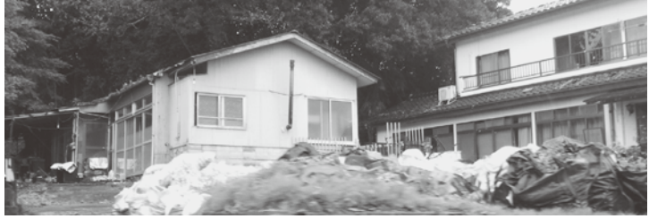
除染後の土は自宅の敷地に置いている

の停止、パートナーの転勤、家族の転院などの理由から定年前退職者が147人にもなっている」と報告がありました。 一方で、職員が147人の採用募集については、「任期の定めがない職員の募集しても定員に達しない。当然、任期付職員では応募が無い。結果、人員不足となり、市の業務にも支障が出ている」と報告がありました。 南相馬市の職員は自らも被災し、精神的にも余裕が無い中でも住民が生活再建できるように、賠償説明、除染した土等の置き場の確保の調整を行っています。こうした増える業務に対する国からの職員確保の具体的な支援が大いに不足していると感じました。